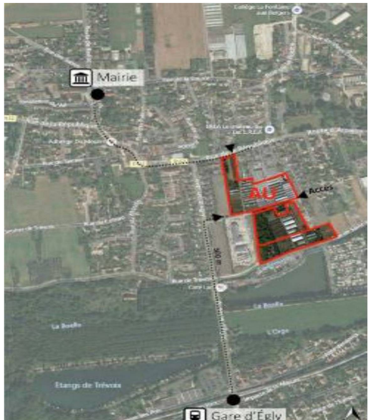
Figure 2 : Localisation du secteur concerné par la modification n° 1 du PLU

D'après les données Insee, la commune a connu une croissance moyenne annuelle de sa population d'environ 1,5 % entre 2010 et 2021, pour une augmentation moyenne de son parc de logements d'environ 2,1 % par an durant la même période, pour atteindre en 2021 1 967 logements, dont 109 vacants (soit 5,5 % du parc).