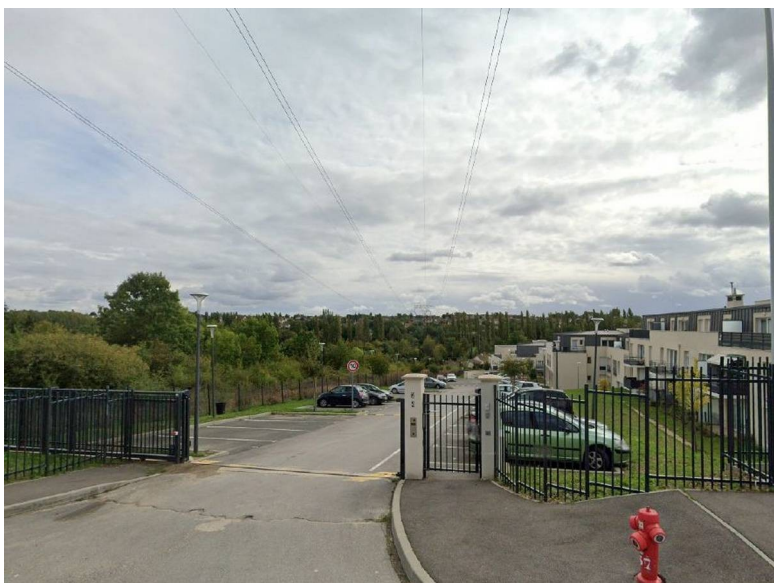
Figure 4: Vue vers le sud depuis le n° 21 de la rue du Gay-Pigeon, montrant le faisceau des trois lignes THT et les bâtiments résidentiels construits dans la phase 1 de réalisation de l'OAP, à l'ouest du périmètre de celle-ci

Le secteur concerné par la modification du PLU, comme l'ensemble du centre-bourg de la commune, est traversé du nord au sud par trois lignes électriques de très haute tension (THT - 400 kV). Cet enjeu est identifié dans l'état initial de l'environnement mais il n'est inexplicablement pas mentionné dans la synthèse hiérarchisée des enjeux environnementaux issue de cet état initial. Il est en revanche pris en compte, dans une certaine mesure, dans l'OAP, dont le schéma de principe représente une bande correspondant au faisceau de lignes THT dans laquelle sont prévus majoritairement des espaces de stationnement ainsi qu'un recul de dix mètres par rapport à ce faisceau pour les logements susceptibles de s'y inscrire à la marge.