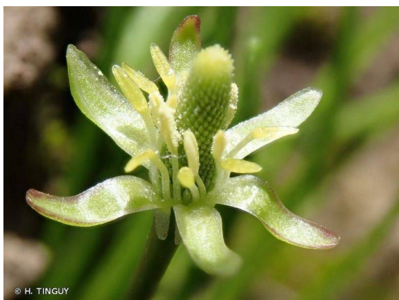
Figure 3: Queue de souris

d'intérêt écologique, faunistique et floristique - Znieff 5 qu'elle détermine, en particulier la Znieff de type 2 « Vallée de l'Orge de Dourdan à la Seine ».