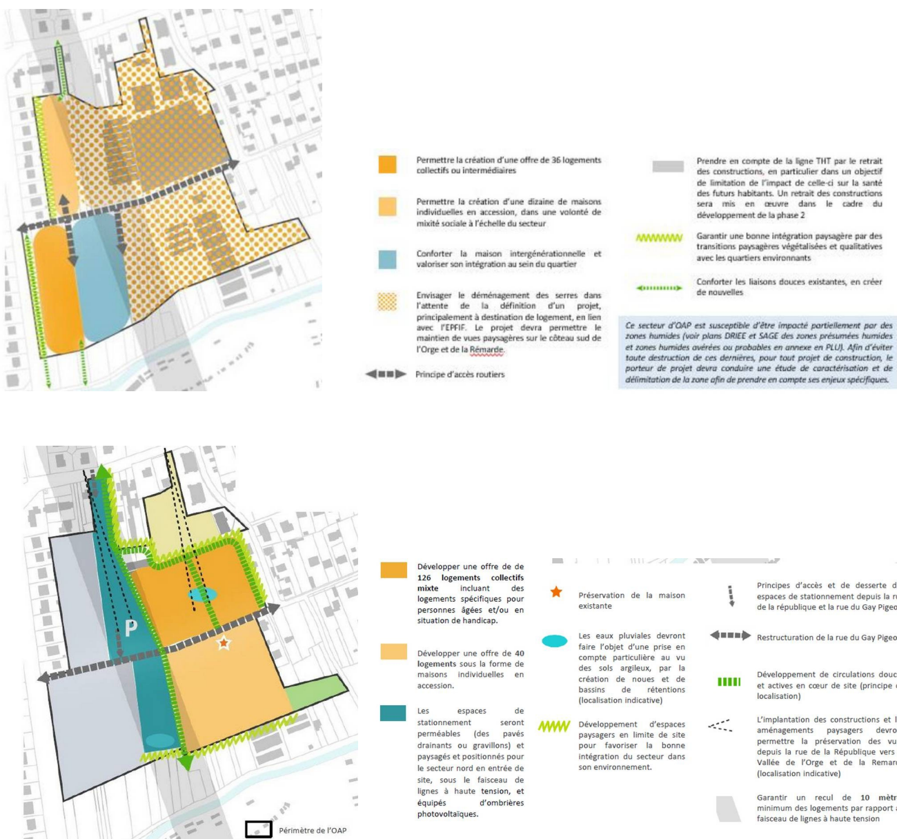
Figure 1 : Schéma de l'OAP du secteur concerné par la modification n° 1 du PLU (en haut, OAP du PLU en vigueur, en bas, OAP du projet de PLU modifié)

Le projet de modification du PLU fait évoluer l'orientation d'aménagement et de programmation (OAP) existant sur ce secteur, en ajustant son périmètre pour tenir compte notamment de la réalisation d'une partie du projet opérationnel, à l'ouest, et pour en préciser la programmation et les principes d'aménagement.